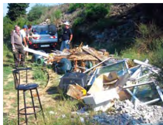
Nettoyage d'un dépôt d'ordures sauvage par un club 4x4.

Le manque de respect envers les autres usagers est rare