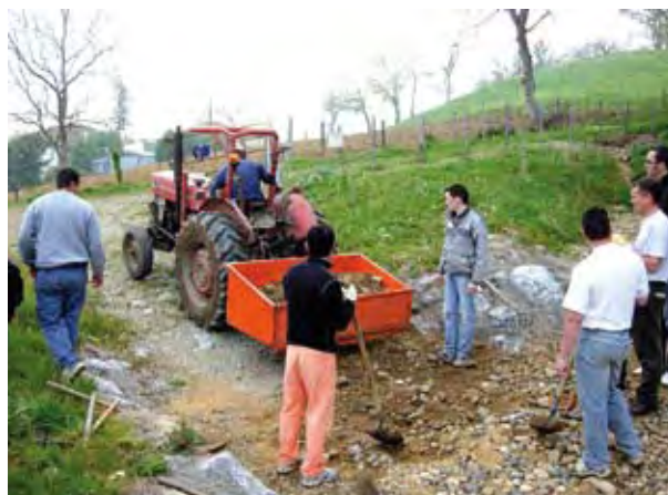
Remise en état d'un chemin rural lors de la 16ème Journée des Chemins, par les bénévoles d'un moto-club.

Ceci est tout simplement impossible techniquement, la plupart des 4x4 disposant d'une garde au sol comprise entre 19 et 30 cm, rarement au-delà. En d'autres termes, le 4x4 ne peut creuser une ornière de plus de 20 à 30 cm de profondeur, puisque son châssis se retrouve rapidement en contact avec le sol.