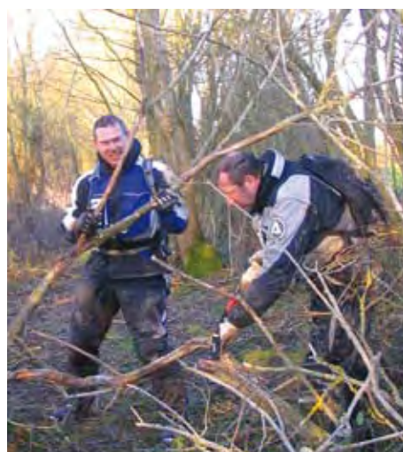
Dégagement de branches mortes pendant une randonnée moto.