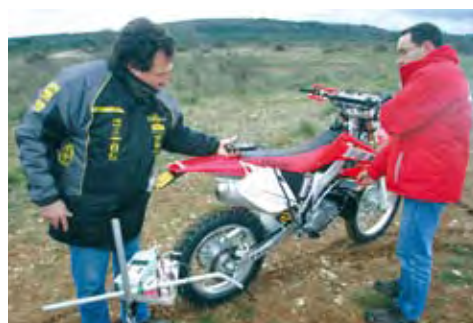
Contrôle du niveau sonore à l'aide d'un sonomètre, au départ d'une compétition.