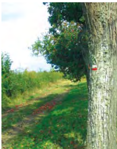
Bien que balisé, ce chemin est ouvert à la circulation des véhicules.

Références : article L 362-2 du Code de l'Environnement