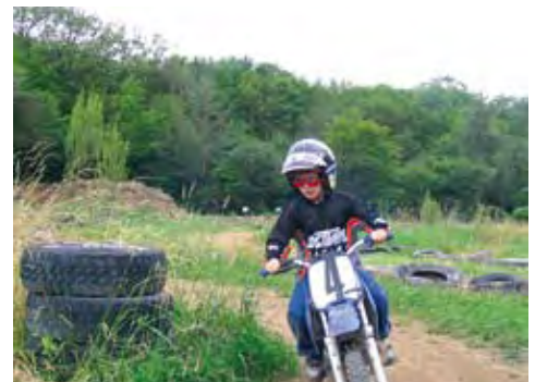
Les mini-motos doivent être réservées à l'initiation des enfants sur des terrains aménagés à cet effet.

Référence : article L 321-1-1 du Code de la Route.